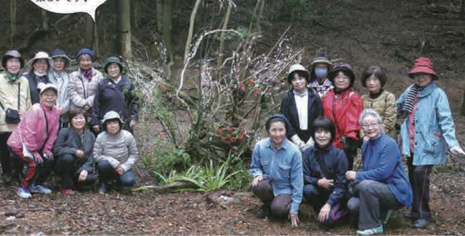
▲花のオブジェ作成！