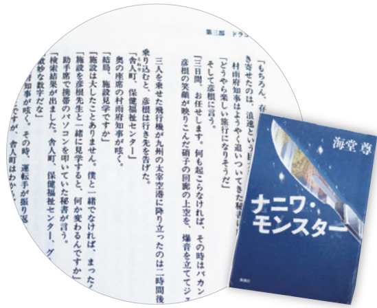
▲ナニワモンスター / 著 海堂 尊

NHKの調査（AIによる分析）によると、健康寿命と密接な関係にあるキーワードは『本や雑誌を読むこと』なのだそうです。読書好きな人は様々なジャンルの本を求めて歩き回ったり、知的刺激を受けることで脳の活性化につながり、健康寿命を伸ばす後押しになっているのではないかと、という結果が出ているようです。皆さんも元気に長生きできるよう『読書』を楽しみませんか？