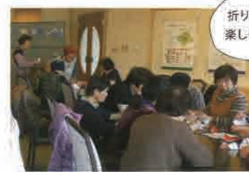
折り紙教室 楽しそうだね〜

長く元気を続けるための「認知症予防カフェ」や初めてでもおいしくできる懐石料理「男の料理教室」など、心とからだの健康をサポートする活動を行なっています。久山町外でも茶道、水墨画、折り紙の教室やイベントなどを開催しており、日本文化を通して国際交流に繋げることを目標に、現在23名で元気に活動しています！