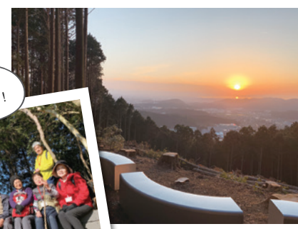
▲首羅山からの眺望